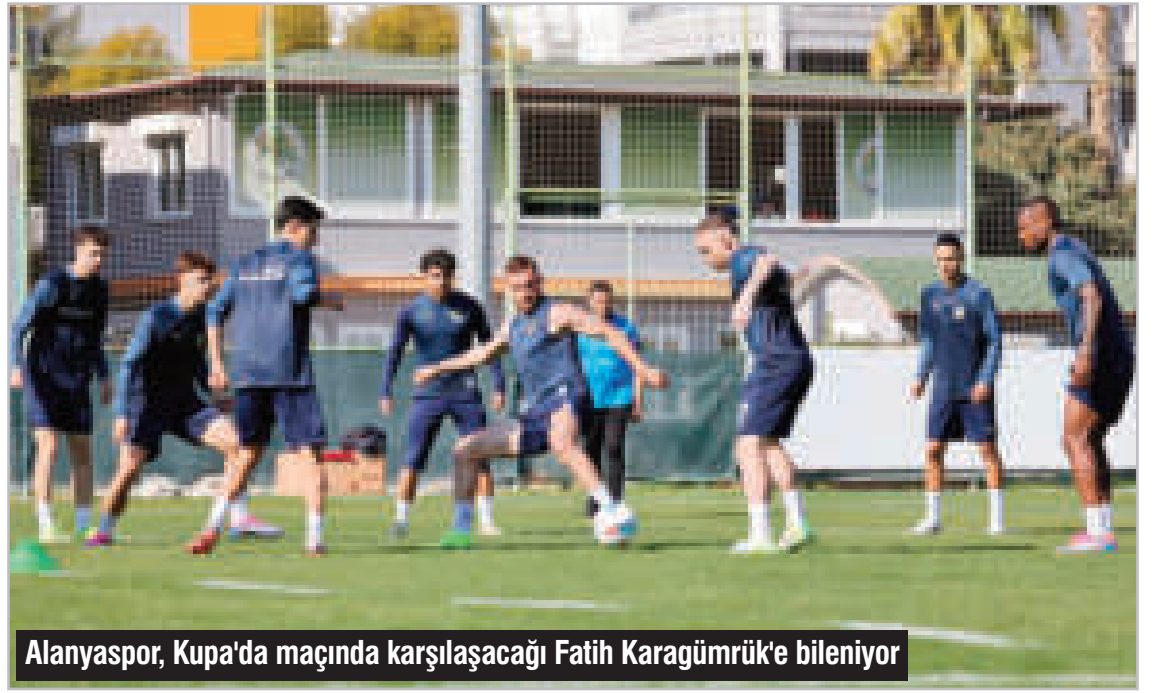
Alanyaspor, Kupa'da maçında karşılaştığı Fatih Karagümrük'e bileniyor

Corendon Alanyaspor, Ziraat Türkiye Kupası A Grubu 2'nci haftasında Perşembe günü oynayacağı Solwie Energy Fatih Karagümrük maçının hazırlıklarını dün yaptığı idmanla sürdürdü. Turuncu yeşilliler, teknik direktör Sami Uğurlu yönetiminde Fatih Karagümrük maçında sahada uygulayacağı taktiği çalıştı. Alanyaspor, hazırlıklarını bugün yapacağı idmanla tamamlayacak. Alanyaspor - Fatih Karagümrük Türkiye Kupası maçı perşembe günü Gain Park Stadi'nda saat 18.30'da oynanacak. ■ Ercan YILDIRIM