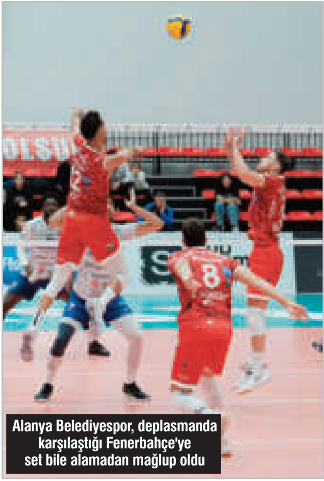
Alanya Belediyespor, deplasmanda karşılaştığı Fenerbahçe'ye set bile alamadan mağlup oldu

On Hotels Alanya Belediyespor, hafta içi mesaisinde deplasmanda karşılaştığı Fenerbahçe Medican'a 3-0 mağlup oldu.